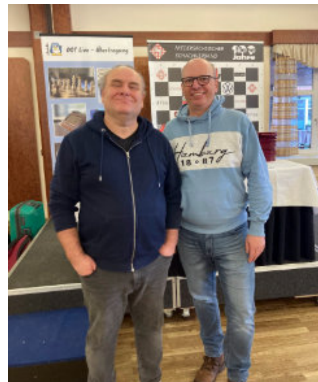
Das Foto stammt von Michael.